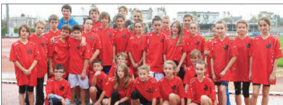
Collège Jules-Ferry Querqueville.