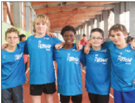
Collège Le Ferronay Cherbourg-Octeville.