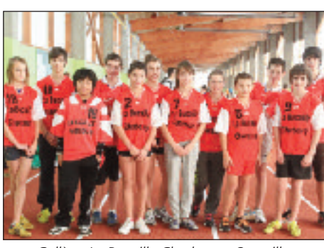
Collège La Bucaille Cherbourg-Octeville.