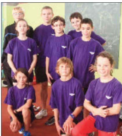
Collège Diderot Tourlaville.

Ils étaient plus d'une centaine de collégiens et de lycéens à s'être donnés rendez-vous dans la salle Maxime-Leluan pour la reprise de la saison en salle de l'UNSS dans le département. Venus des quatre coins de la Manche, tous les athlètes s'en donnaient à cœur joie pendant tout un après-midi qui était consacré uniquement à l'athlétisme. D'abord, les élèves s'affrontaient donc sur des épreuves de sprint (50 mètres et 50 mètres haies), avant d'enchaîner sur le lancer du poids, pour enfin terminer sur des épreuves de saut à la perche, en hauteur, ou encore en longueur. Dans les catégories benjamins, minimes et cadets, garçons et filles se sont donc donnés à fond le temps de quelques heures, pour ce qui reste encore une étape de découverte, où la performance passe après le plaisir. Car en effet, les choses sérieuses commenceront lors du prochain rendez-vous entre ces concurrents, à Mondeville le 21 novembre. En attendant, novices et habitués ont très certainement pris beaucoup de plaisir et ce retrouverons sans aucun doute lors des prochaines rencontres UNSS.