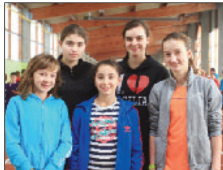
Collège Le Corre Equeurdeville.